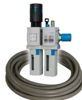
Obj. č. 27221 (pouze pro pneumatické modely)