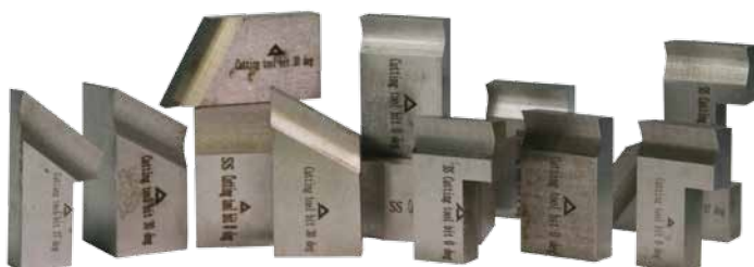
Řezné nástroje viz.strana 48 - 50